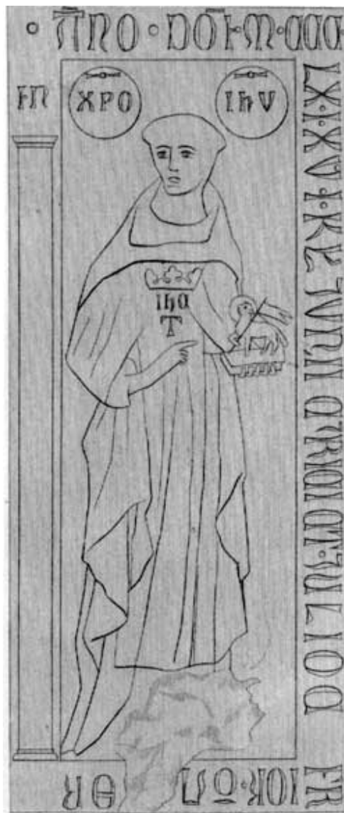
Lithographie de Simon (reproduite par Charles Schmidt)