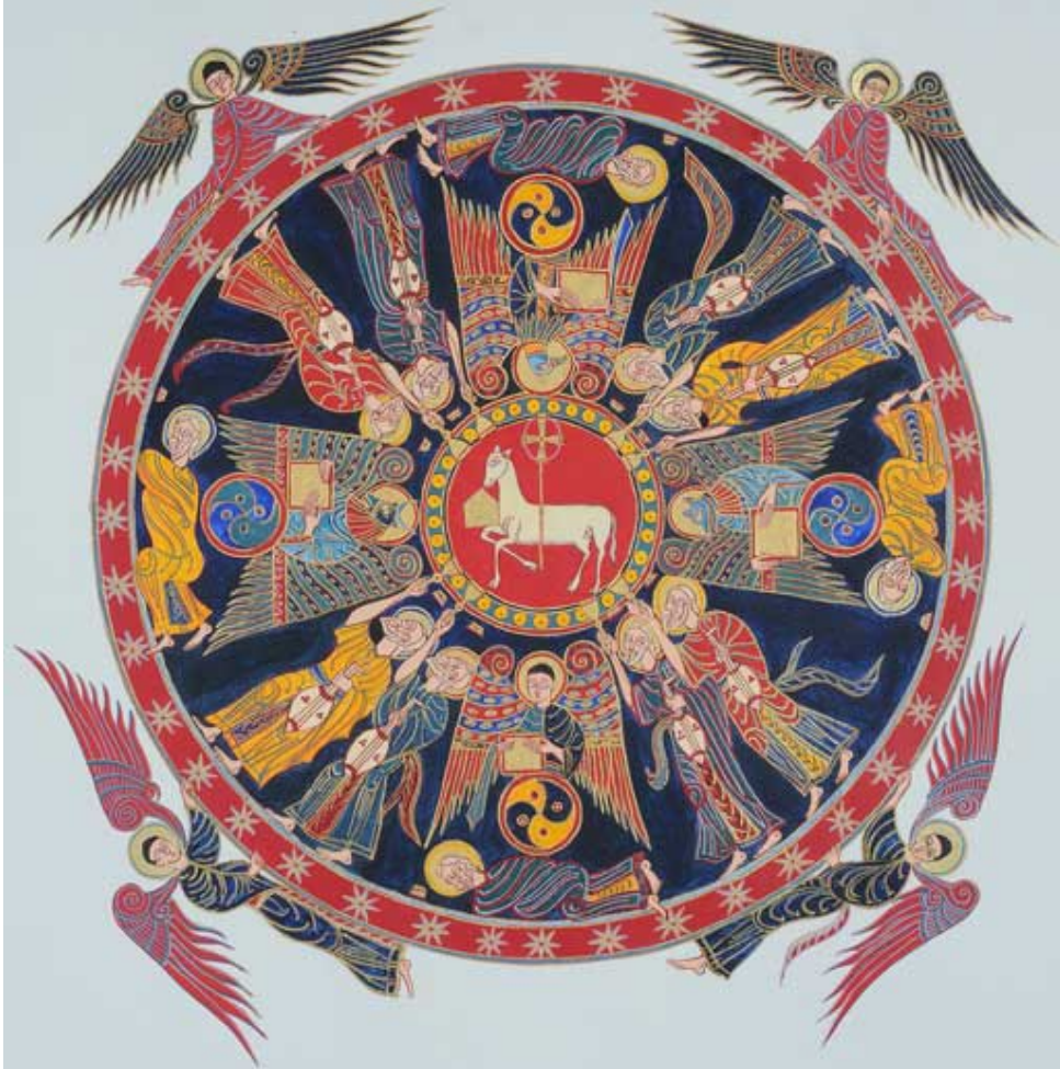
Théophanie : l'Agneau mystique , folio 15, tempera, coquille d'or et eau de noyer sur papier d'Arches, format : 41 cm de diamètre.

montre la voie pour que l'homme ouvre entièrement son cœur à ce « Dieu fait homme, pour que l'homme devienne Dieu », selon un adage des Pères.