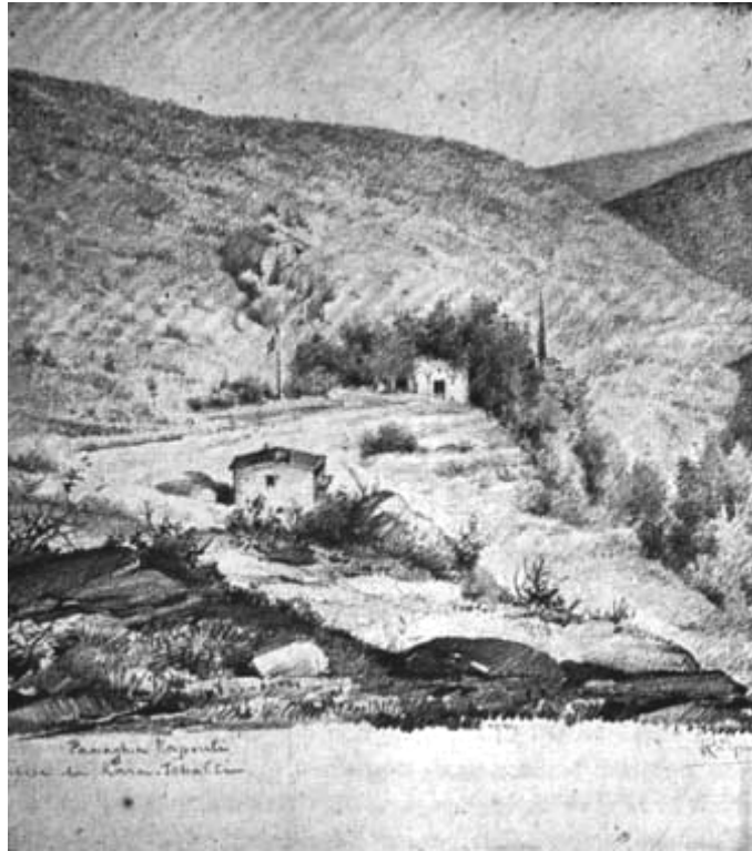
R. Péré, État du site de Panaya à l'époque de la découverte (1891)