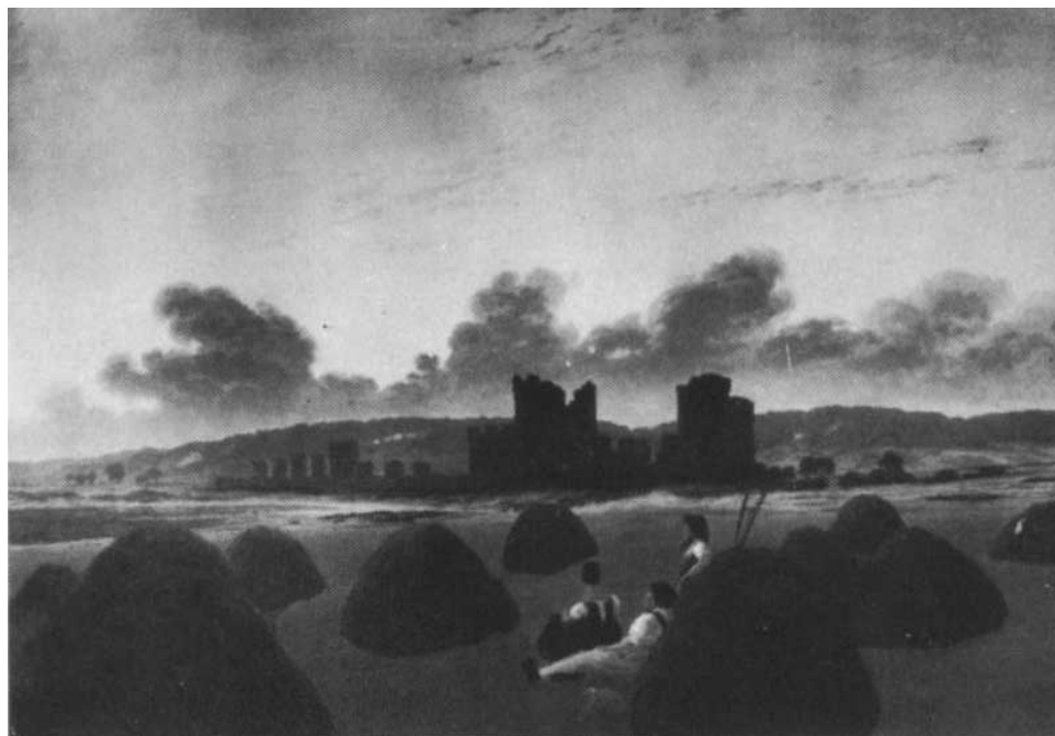
Le repos pendant la fenaison, 1835 (?).

Le tableau décrit par Hyppolite Fortoul, inachevé, et une des dernières œuvres de C.D. Friedrich, a fait partie de la succession du peintre et a disparu. On peut le mettre en relation avec une œuvre de la même époque, inachevée elle aussi, et qui est conservée de nos jours à la Kunsthalle de Hambourg : L'aube près de Neu-Brandenbourg, 1835 :