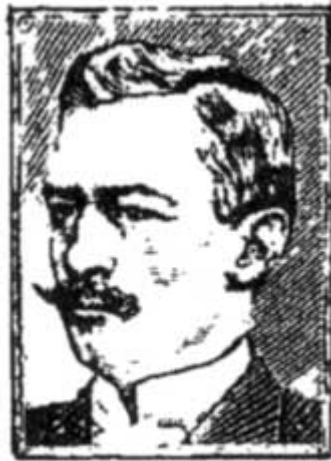
M. SVEN HEDIN.