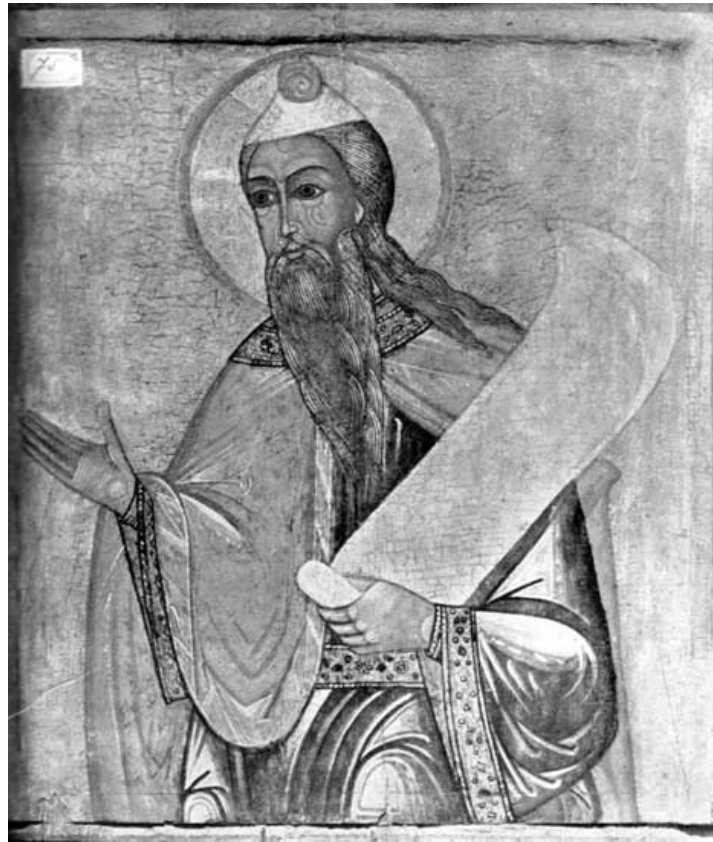
Le prophète Elie, icône russe

attitude qui soutien Élie prosterné au sommet du Carmel en attendant la pluie : complètement immobile, il se condamne à ne rien voir, comme pour appeler la présence de Dieu et Son action imminente ( I Rois 18,42-44). De même, lorsque il reçoit la théophanie sur l'Horeb, Élie se voile le visage comme s'il disparaissait devant la présence du Seigneur, car une créature ne peut pas voir la face de Dieu sans mourir ( Ex 33,20). Le « dépouillement de soi », c'est, en effet, l'itinéraire qui mène le serviteur parfait à se faire instrument de résonance de la présence de Dieu. Tel est le but de la purification. Dans les explications d'al-Khidr, de ses gestes absurdes et gratuits, on peut retrouver cachée également cette disparition progressive de l'ego dans la présence divine, comme le miroir disparaît derrière l'image qu'il réfléchit 6 .